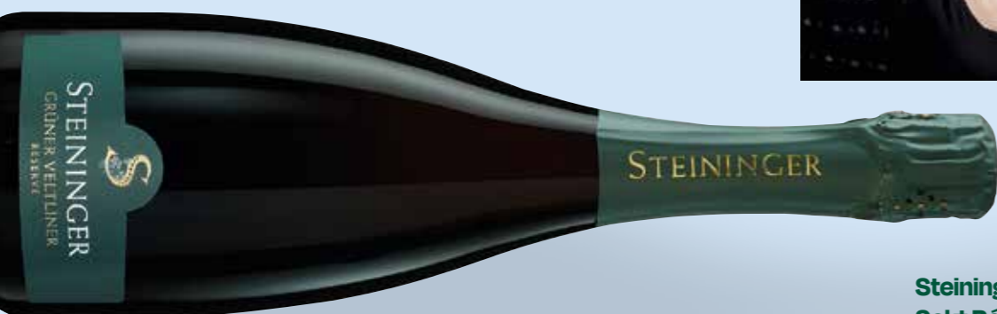
Steininger Grüner Veltliner Sekt Réserve