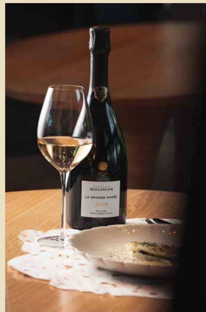
Bollinger La Grande Année Brut 2018