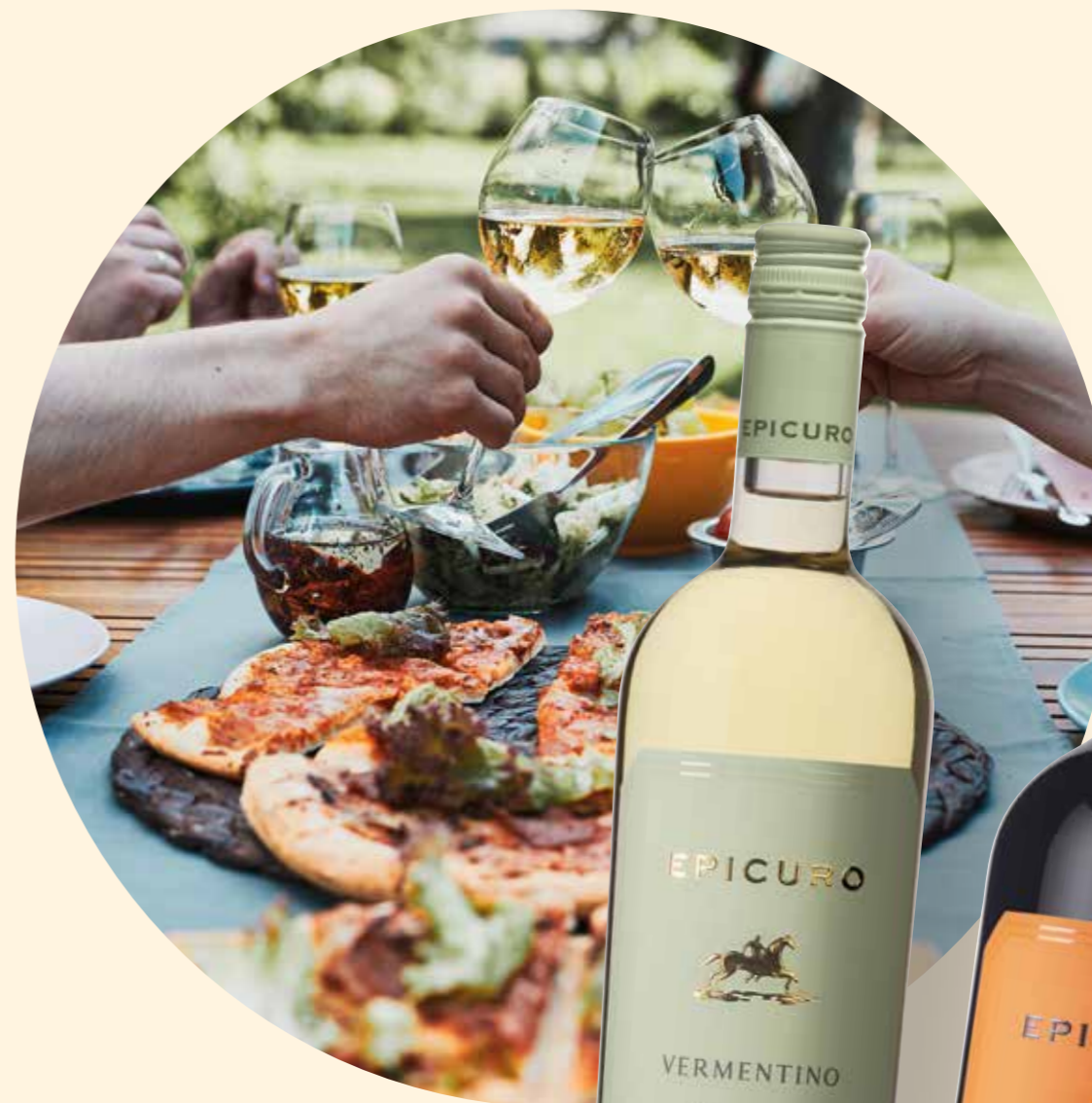
Epicuro Vermentino en Montepulciano d'Abruzzo